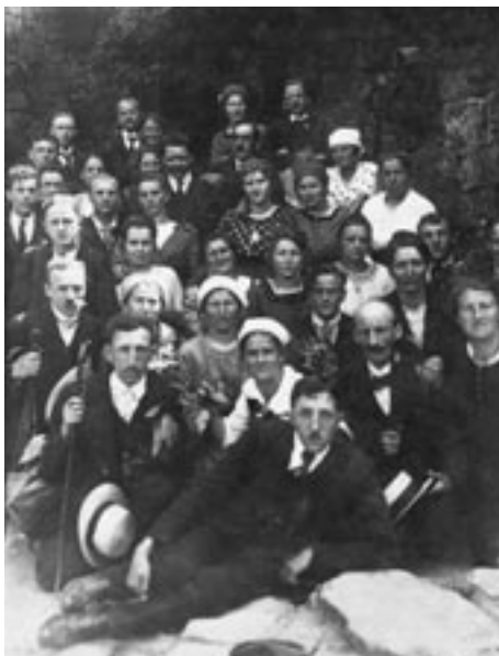
Der Evangelische Kirchenchor während einer Rast bei ihrem Ausflug im Juni 1921 nach Annweiler.

Ausführliche Chronik in der Festschrift: 100 Jahre Ev. Kirche Hassel, 2008.