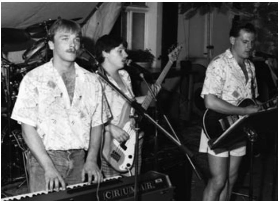
Auftritt beim MGV Frohsinn während des Ingobertusfestes 1986 im Hof der „Grünen Laterne“.