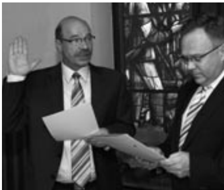
Oberbürgermeister Georg Jung vereidigt Markus Derschang erneut als Ortsvorsteher.

Am 7. Juni 2009 waren genau 2.900 Hasseler Bürger zur ersten Wahl im Superwahljahr, der Europa- und Kommunalwahl, aufgerufen, um von ihrem Wahlrecht Gebrauch zu machen. Am geringsten war die Wahlbeteiligung mit 50,26 % bei der Europawahl. Hier hatten von 2.845 Wahlberechtigten nur 1.430 ihre Stimme für die 31 Parteien abgegeben. Etwas anders sah in Hassel die Stimmabgabe bei den Wahlen für den neuen Orts- und Stadtrat sowie den Kreistag aus. Hier lag die Wahlbeteiligung jeweils bei 61,6 %.