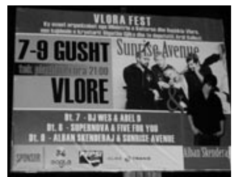
Plakatwand in Vlora.