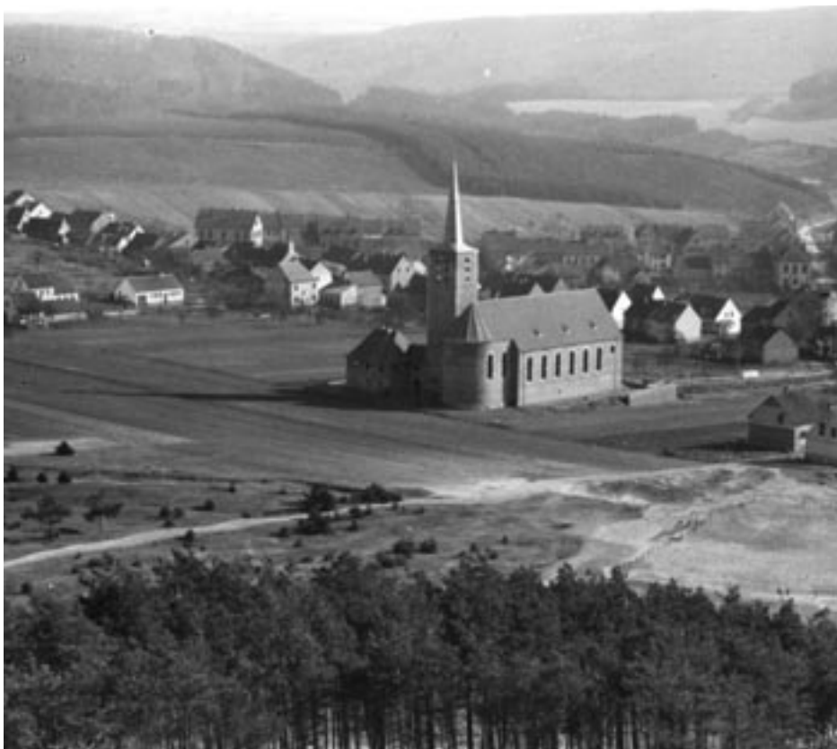
Blick vom Kahlenberg auf die neu errichtete Kirche.