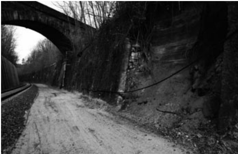
Einseitig saniert und auf der anderen Seite sind die riesigen Schäden im März 2009 noch sichtbar.