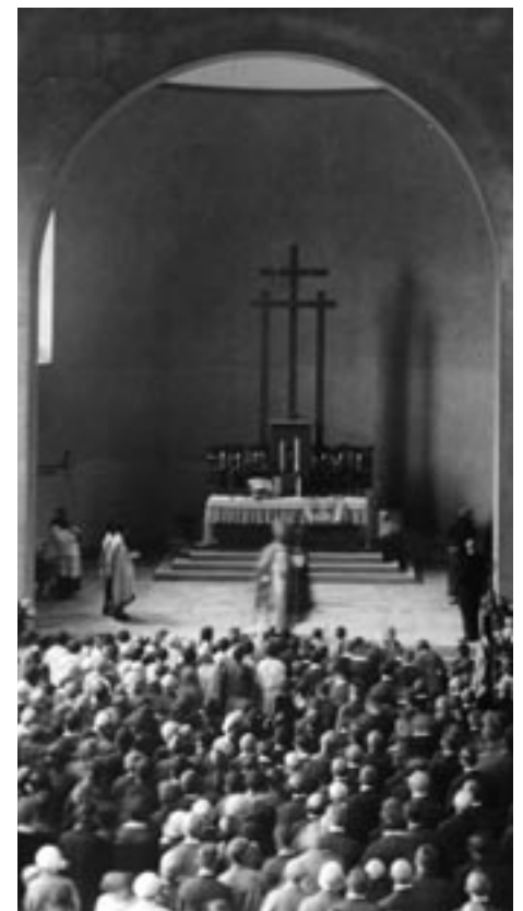
Einweihung durch Bischof Dr. Ludwig Sebastian.