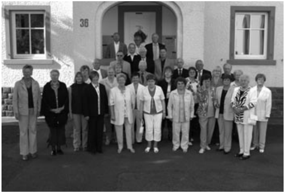
Der Evangelische Kirchenchor Hassel 2008.

Im Laufe der Zeit nahm man auch Verbindung zu anderen Chören auf. So besuchte der Kirchenchor an Pfingsten 1934 den Kirchenchor Heidelberg-Rohrbach. Für 1936 war der Gegenbesuch in Hassel angekündigt. Auch während den Wirren des Zweiten Weltkrieges wurde – wie schriftlich vermerkt ist – an allen Feiertagen sowie nach Möglichkeit auch bei Beerdigungen gesungen. Die schöne Sitte, bei Beerdigungen von erwachsenen Gemeindemitgliedern zu singen, musste der