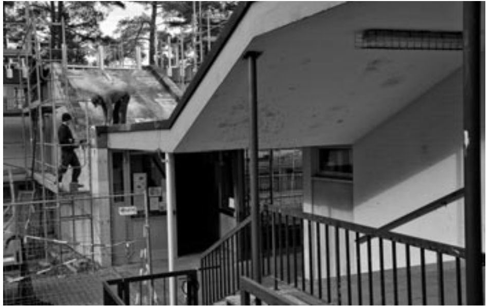
Begonnen haben die Sanierungsarbeiten.

Die Schule wird ein neues Gesicht bekommen. Die komplette Fassade wird mit vorgehängten, wärmegeprägten Trespa-Platten, in herbstlichen Farbnuancen von hellgelb bis grün versehen. Durch den Austausch der bestehenden Fenster und Türen mit Einscheibenverglasung mit neuen wärmegeprägten Holz-Alu-Fenster und Türelementen wird zusätzlich Energie eingespart. Als Wärme- und Blendschutz wird an den Fenstern der Süd-Ostseite ein Sonnenschutz aus Alulamellen angebracht. Die durch die Fassadenarbeiten anfallenden Anschlussarbeiten im Bereich der anschließenden Innenwände, der Innenfensterbänke, der Gitterabdeckungen der Lichtschächte, des Blitzschutzes und der angrenzenden Hof- und Grünflächen werden im Zuge der Baumaßnahme ebenfalls durchgeführt, so dass nach der Sanierung