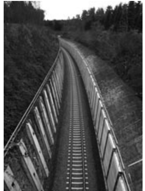
Eingezwängt präsentiert sich im November 2009 die sanierte Bahnstrecke.

zum Tunnel befragt. Diese geschichtliche Aufarbeitung ist nun im Wasser-Verlag auf 113 Seiten unter dem Titel „Der Hasseler Tunnel – Ein Bauwerk der Eisenbahn mit ungewöhnlicher Geschichte“ erschienen. Vorgestellt wurde das Buch mit zahlreichen Fotos und Zeichnungen am 4. November 2009 im Sitzungssaal des Hasseler Rathauses. Erhältlich ist das Buch bei der Ortsverwaltungsstelle Hassel oder unter info@dhwirth.de zum Preis von 12 Euro.