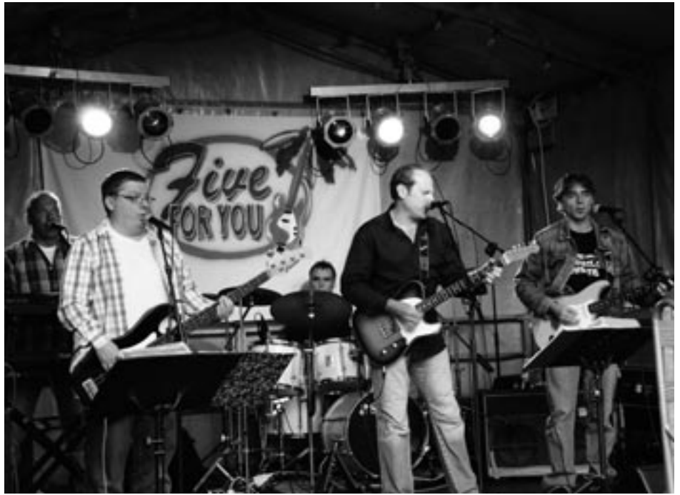
Die „FIVE FOR YOU“ spielten selbst ihren Gästen bei der Geburtstagsfeier in der Alten Schulturnhalle in Hassel auf.