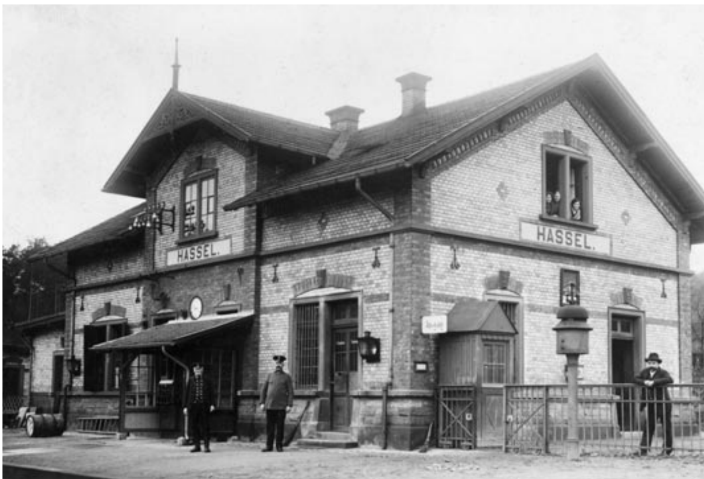
Der Hasseler Bahnhof um 1913.

Der Arbeitskreis Heimatgeschichte im Heimat- und Verkehrsverein Hassel sucht ständig alte Fotos und Dokumente zur Ortsgeschichte. Wer an der Aufarbeitung mitarbeiten will oder Dokumente zur Verfügung stellen will, melde sich bitte bei Dieter Wirth, ☎ 06894/570719 oder info@dhwWirth.de