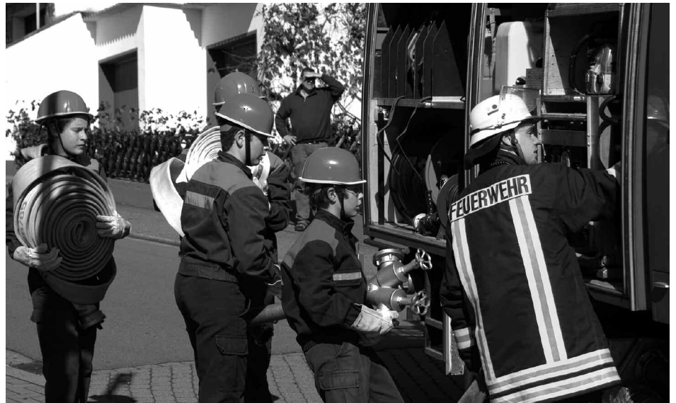
Aus allen St. Ingberter Stadtteilen waren Jugendfeuerwehren an der Jahresübung in Hassel beteiligt.

Anlass für diese Großübung war das 35-jährige Jubiläum der Jugendfeuerwehr des Löschbezirks Hassel. Seit 1972 ist diese Garant für eine kontinuierliche Personalentwicklung der Aktiven Wehr. - JS -