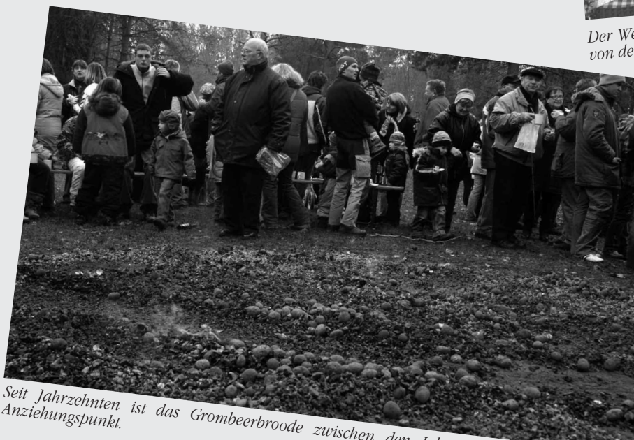
Seit Jahrzehnten ist das Grombeerbroode zwischen den Jahren im Fröschenpfuhl ein Anziehungspunkt.