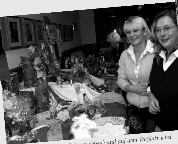
Der Weihnachtsmarkt im Rathaus (oben) und auf dem Vorplatz wird von den Hasseler Vereinen und Verbänden durchgeführt.