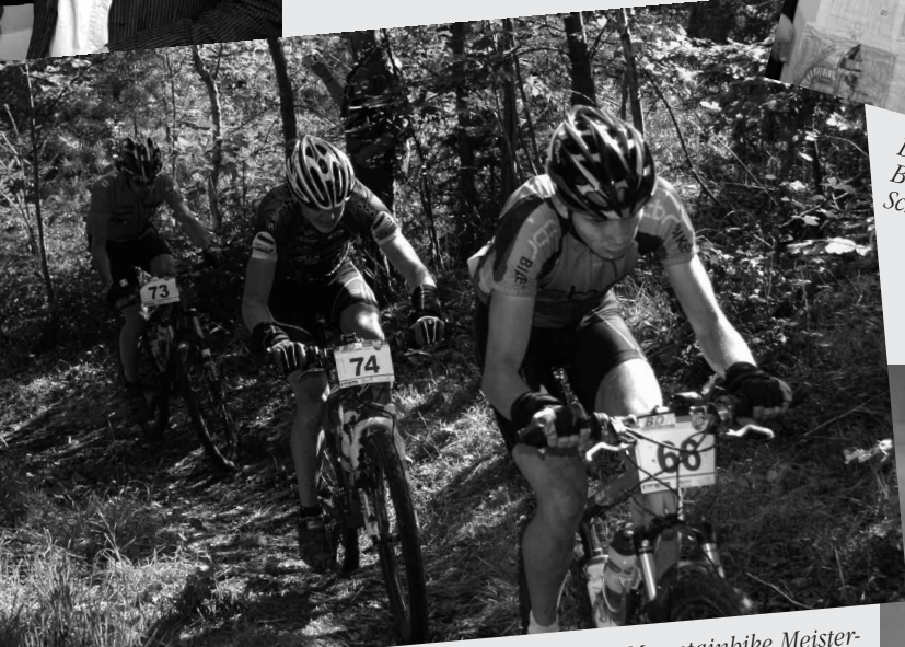
Viel abverlangt wurde den Fahrern bei den Deutschen Mountainbike Meisterschaften an der Hasseler Höllenauffahrt.