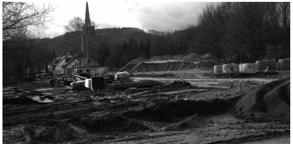
Noch gleicht das Neubaugebiet einer Mondlandschaft.

schlossen worden war, den günstigsten Quadratmeterpreis aller städtischen Grundstücke innerhalb der Stadt mit Sonderkonditionen für Familien mit Kindern in Hassel anzubieten. Der Bedarf an Neubaufächen ist nach wie vor vorhanden, wie die positive Entwicklung des Bebauungsgebietes „Auf der Heide“ gezeigt hat. - md -