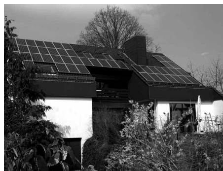
Solaranlage in Hassel.

Der Bundesverband Solarwirtschaft (BSW) organisierte vom 28. April bis 6. Mai 2007 die Aktion „Woche der Sonne“, um die Solarenergie bundesweit in den Fokus des öffentlichen Interesses zu rücken. Der Ortsrat Hassel setzt sich für die Nutzung „Erneuerbare Energien und eine Energieeffizienzoffensive“ ein. Die Agenda 21 Gruppe St. Ingbert sieht in dem Ausbau der photovoltaischen und der thermischen Solarnutzung entscheidende Potentiale, einen attraktiven Beitrag zur Erhaltung unserer heimischen Umwelt zu leisten. Das Ziel dabei ist, durch öffentlichkeitswirksame Aktionen in den Regionen das Interesse an der Nutzung der Solarenergie deutlich zu erhöhen und die Möglichkeiten einer solaren Energieversorgung auch für den einzelnen Bürger aufzuzeigen. Die Energie-Initiative – Solarstadt St. Ingbert (eine Gruppe der Lokalen Agenda 21 St. Ingbert) und der Ortsrat Hassel betei-