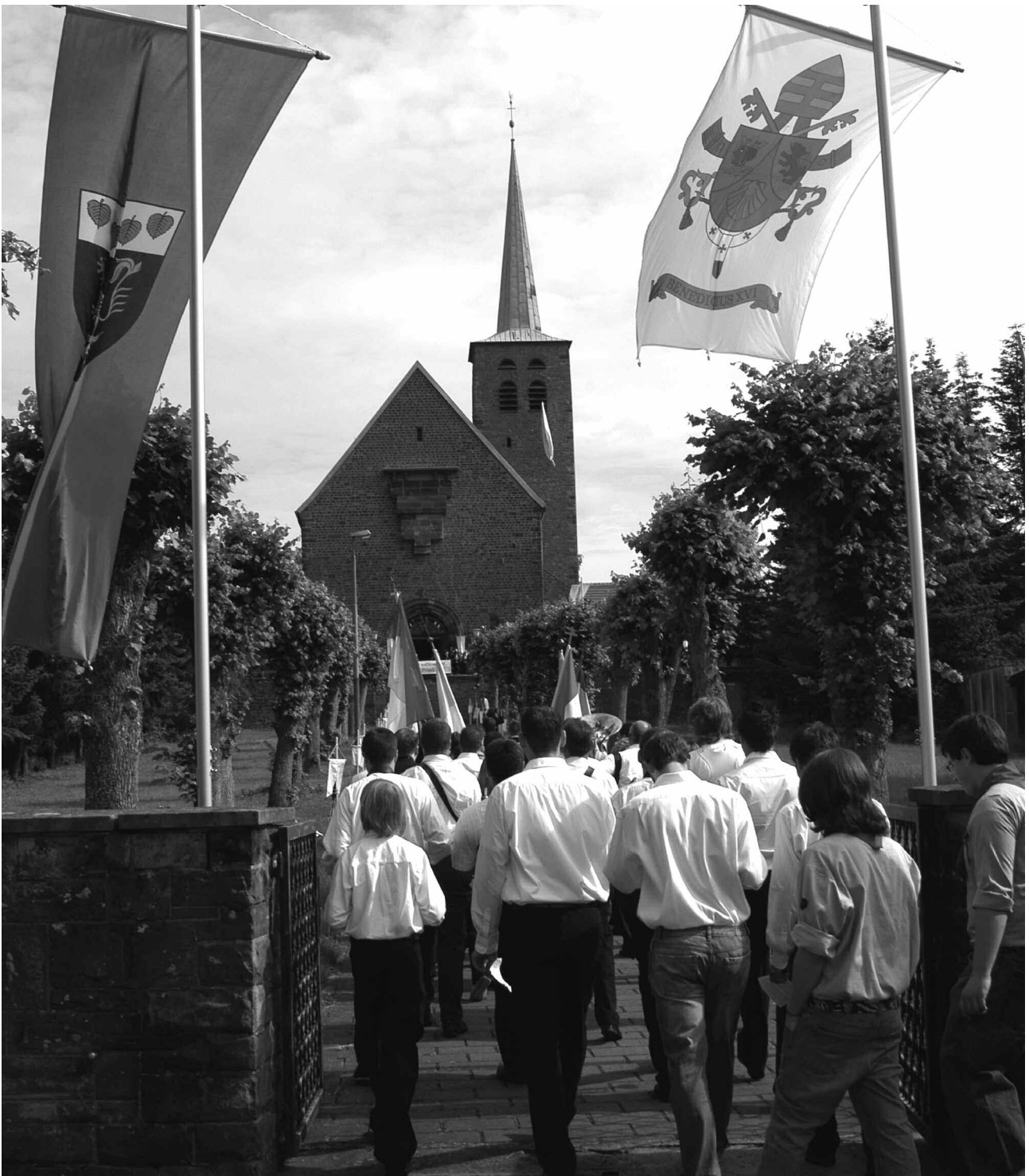
Festlicher Einzug in die Kirche Herz-Jesu