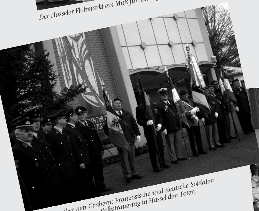
Versöhnung über den Gräbern: Französische und deutsche Soldaten gedachten gemeinsam am Volkstrauertag in Hassel den Toten.