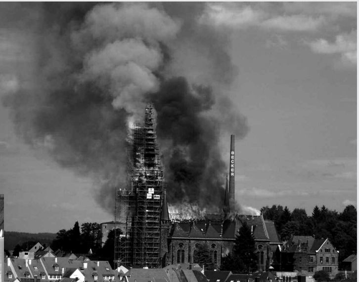
Eine schwere Brandkatastrophe zerstörte am 17. Juli 2007 das gesamte Kirchendach und den Turm von St. Josef. Es entstand ein Millionenschaden. Bis Weihnachten soll der originalgetreue Wiederaufbau abgeschlossen sein.