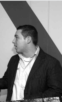
Nun hat auch die Hasseler Jugend seit Januar im Untergeschoss der Kita Sonnenblume einen eigenen Raum zur Freizeitgestaltung.