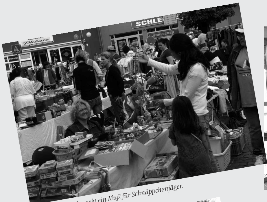
Der Hasseler Flohmarkt ein Muß für Schnäppchenjäger.