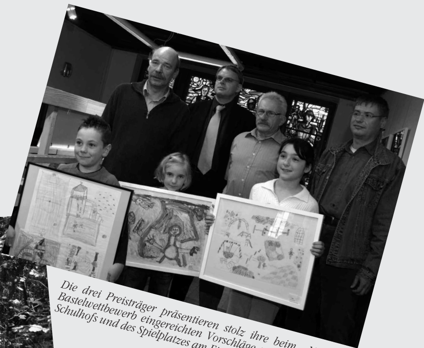
Die drei Preisträger präsentieren stolz ihre beim Mal- und Bastelwettbewerb eingereichten Vorschläge zur Gestaltung des Schulhofs und des Spielplatzes am Eisenberg.