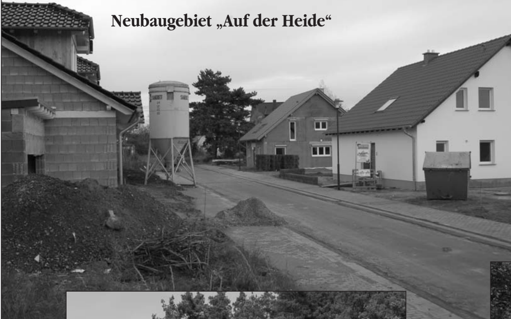
Neubaugebiet „Auf der Heide“