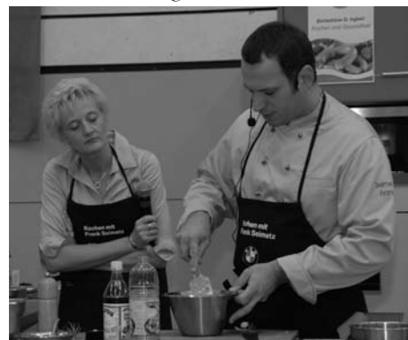
Dicht umlagert war die aufgebaute Show-Kochküche bei den Vorführungen der Spitzenköche in der Eisenberghalle. Für die Besucher gab es nicht nur Tipps vom Profi, sondern sie waren auch zum Probieren und zur Mitarbeit eingeladen.

Nicht nur aus dem Saarland, sondern auch aus Baden-Württemberg, Hessen, Rheinland-Pfalz und dem benachbarten Frankreich waren Verlage und Händler gekommen, um ihre Bücher auf dieser besonderen Plattform anzubieten. Die Besucher konnten so richtig nach Herzenslust schmökern und auch schon einige Geschenke für Weih-