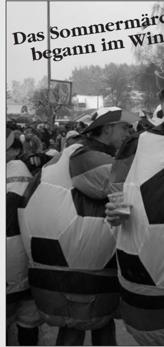
Das Sommermär... begann im Win...