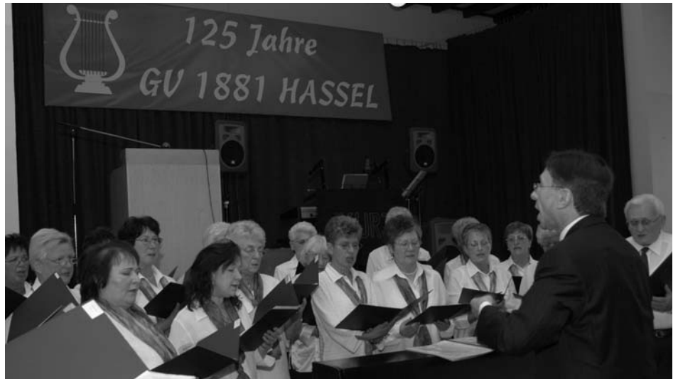
Mit einem Festkommers eröffnete der GVH sein Jubiläumsjahr