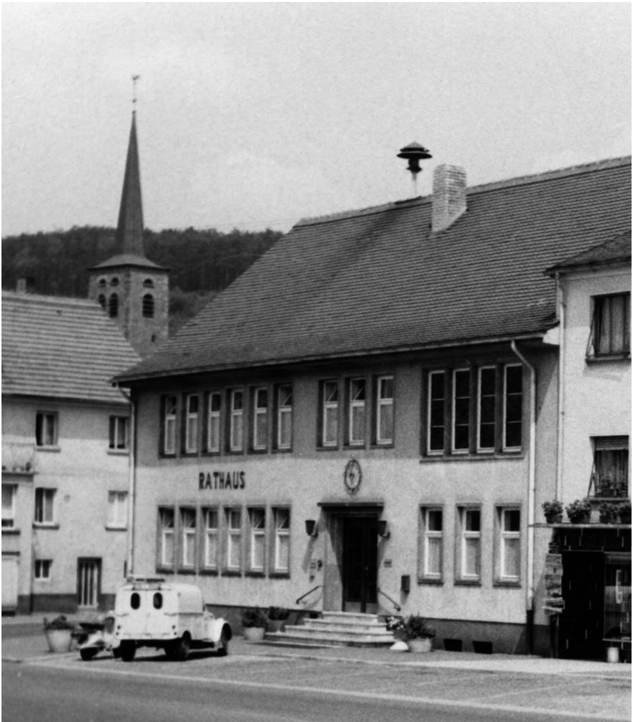
Neues Rathaus vor 50 Jahren