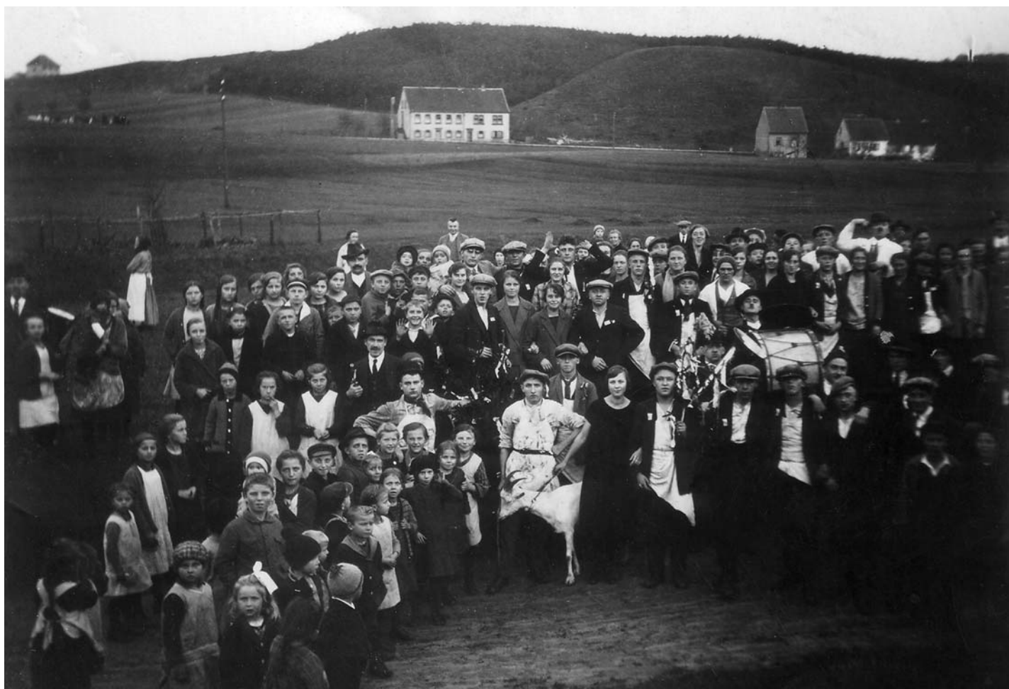
Kerb mit Hammel. Die Kerwegesellschaft hat sich im Wiesental nahe Altenhof für den Fotografen aufgestellt.

Wer kennt Personen oder Hintergründe? Der Arbeitskreis Heimatgeschichte im Heimat- und Verkehrsverein Hassel sucht ständig alte Fotos und Dokumente zur Ortsgeschichte. Wer an der Aufarbeitung mitarbeiten will oder Dokumente zur Verfügung stellen will, melde sich bitte bei Dieter Wirth, Telefon 06894/570719 oder info@dhwWirth.de