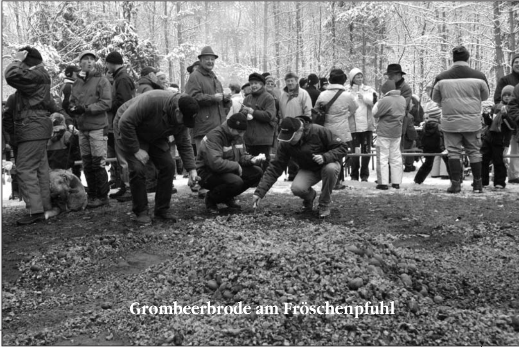
Grombeerbrode am Fröschenpfuhl