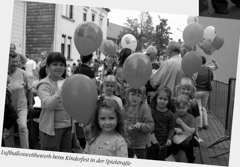
Luftballonwettbewerb beim Kinderfest in der Spielstraße