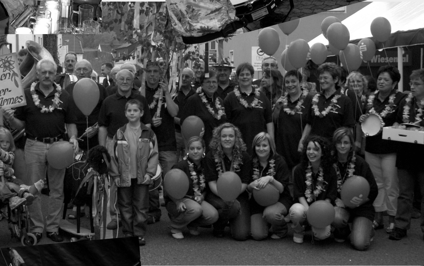
Haseler Straußmäde un -buwe