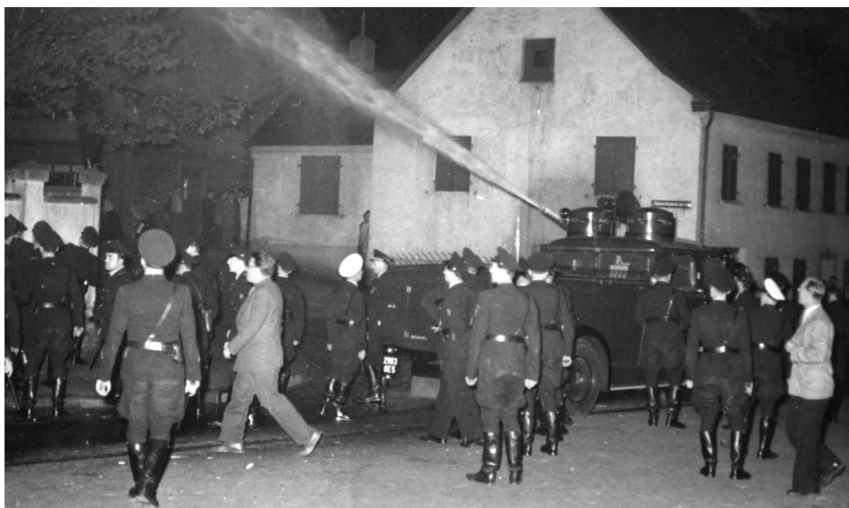
Wasserwerfereinsatz während der CVP-Kundgebung im Karlsbergsaal am 18. 8. 1955.