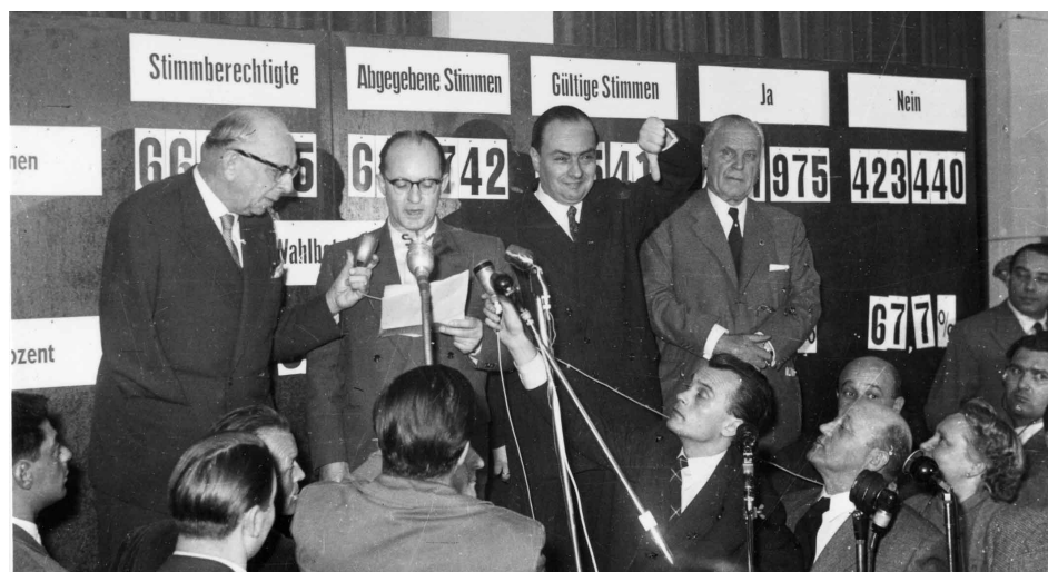
Bekanntgabe des Abstimmungsergebnisses im Landtag durch die Parteiführer der Heimatbundpartei.

beim Verteilen von Flugblättern, Kleben von Plakaten, beim Entfernen derselben und auch in handgreiflichen Auseinandersetzungen.