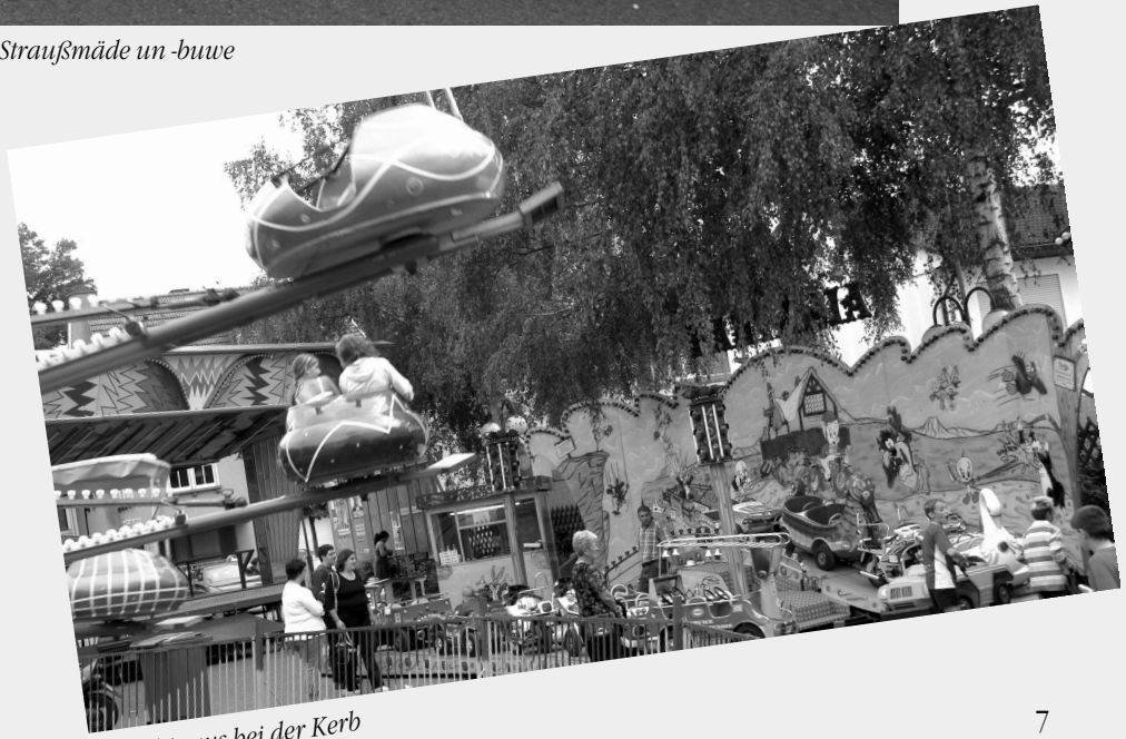
Hoch hinaus bei der Kerb