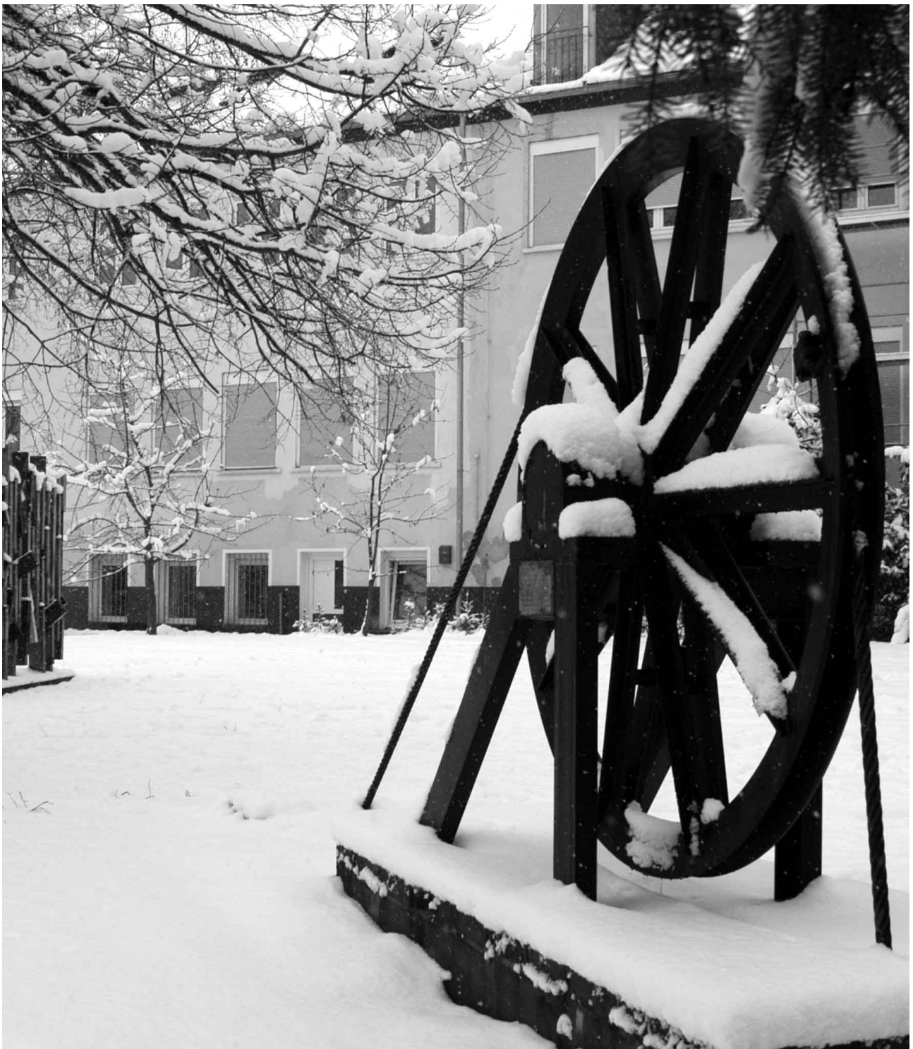
Eingeschmet: Seilscheibe vor der alten Schule