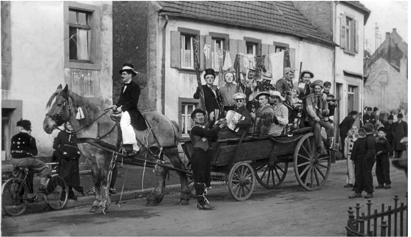
Treiben an Fastnachtsdienstag in Hassel am 26. Februar 1952

Wer kennt Personen oder Hintergründe? Der Arbeitskreis Heimatgeschichte im Heimat- und Verkehrsverein Hassel sucht ständig alte Fotos und Dokumente zur Ortsgeschichte. Wer an der Aufarbeitung mitarbeiten will oder Dokumente zur Verfügung stellen will, melde sich bitte bei Dieter Wirth, Telefon 06894/570719 oder info@dhwWirth.de