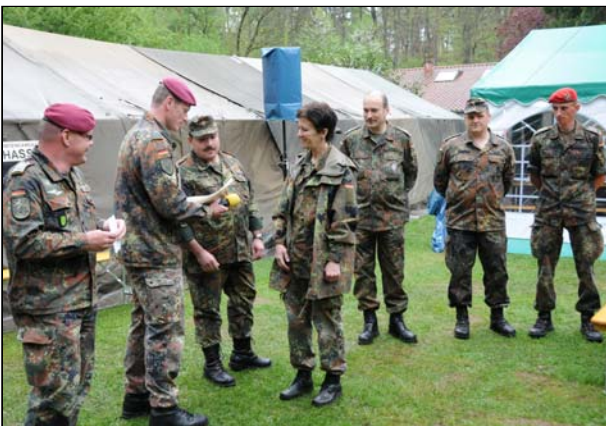
Auch in diesem Jahr ehrte die Reservistenkameradschaft einige verdiente Reservisten.