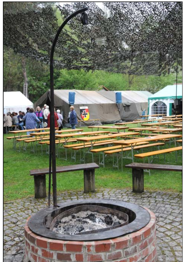
Der Schwenker und manche Bank blieben an diesem Tag leer. Viele Besucher hielt der Regen ab.