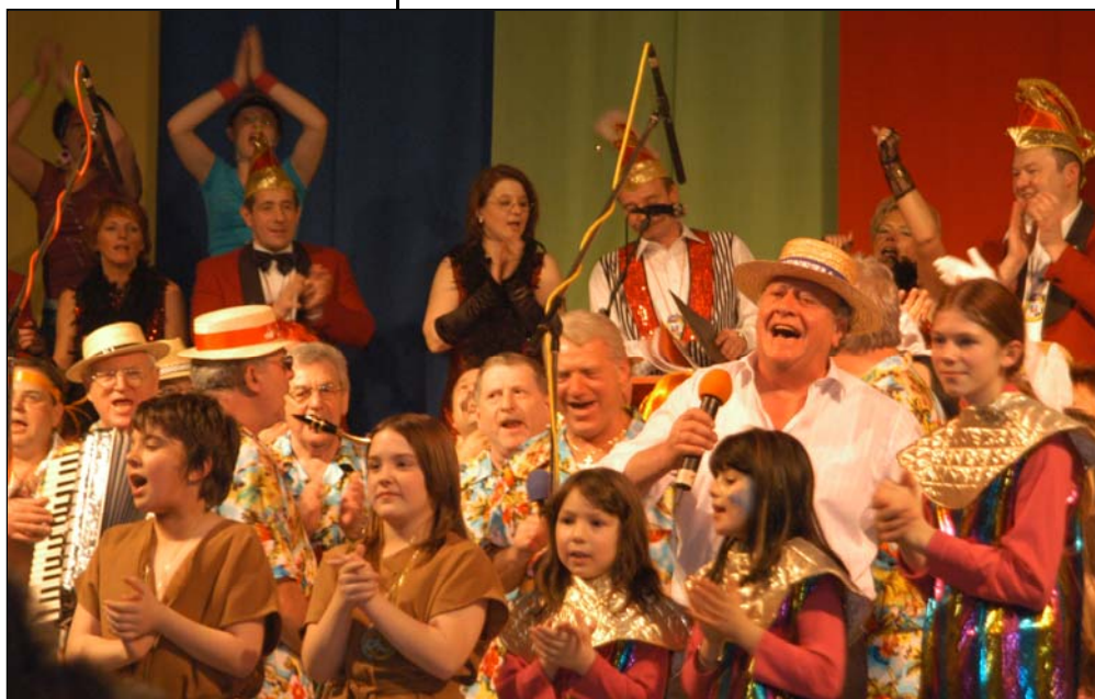
Stimmungsvolles Finale mit allen Akteuren