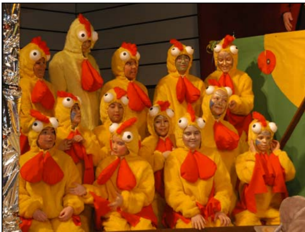
Minigarde: Nicht nur Moorhühner wurden hier aufs Korn genommen.